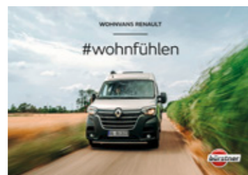
Die Baureihe Delfin finden Sie in einem separaten Folder