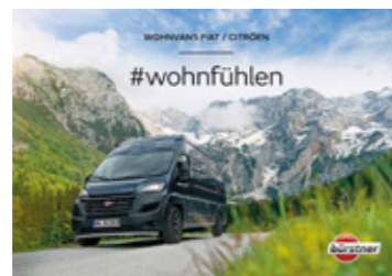
Die Baureihen Campeo und Eliseo finden Sie in einem separaten Folder