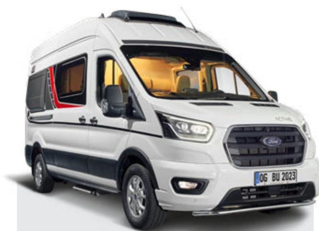
Der großzügige Spontane